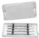
Estojo Curetas de Levantamento de Seio